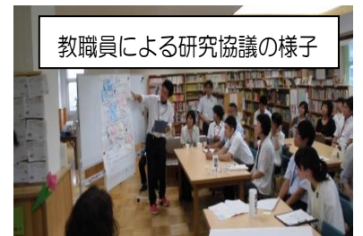
教職員による研究協議の様子

第1学年「英語科」では、英語での「自己紹介」を通して、「聞く力」「話す力」を育てる授業が行われました。参観の教職員にインタビューする場面もあり、生徒たちは積極的に「聞く」「話す」活動に取り組もうとしていました。