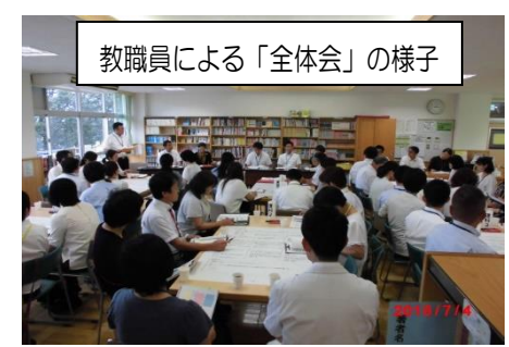
教職員による「全体会」の様子